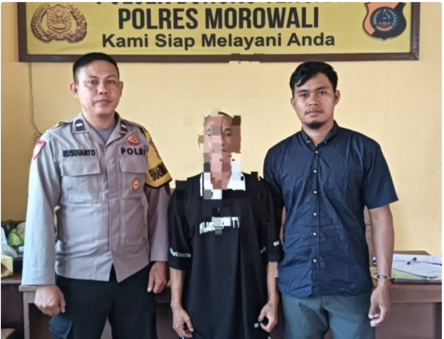
Aparat Polsek Bungku Tengah Berhasil Tangkap Pelaku Curanmor

MOROWALI, Sulawesi Tengah- Pada Hari Sabtu 5 Oktober 2024 Sekitar Pukul 18.30 Wita Kepolisian Sektor (Polsek) Bungku Tengah Polres Morowali, berhasil mengungkap kasus pencurian kendaraan bermotor (curanmor) yang terjadi di